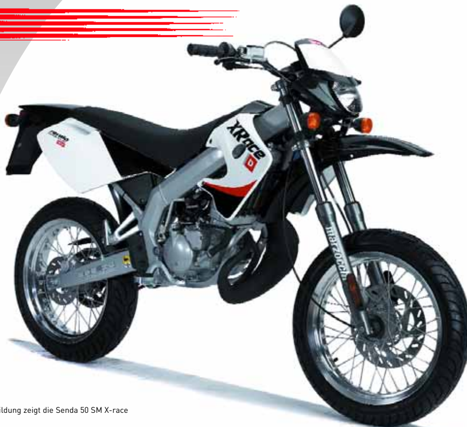
Abbildung zeigt die Senda 50 SM X-race

Irrtümer und technische Änderungen vorbehalten. Abbildungen können vom Produkt abweichen.