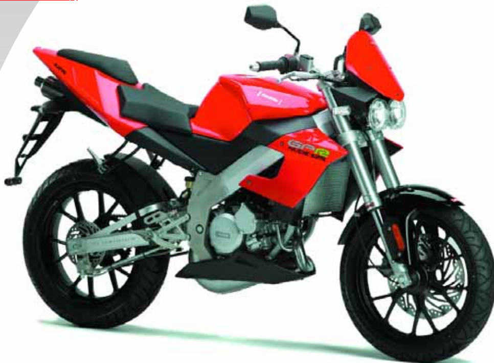
Abbildung zeigt die GPR 125 Nude

25 km/h-Drossel für die 50er sowie 80 km/h-Drossel für die 125er auf Anfrage.