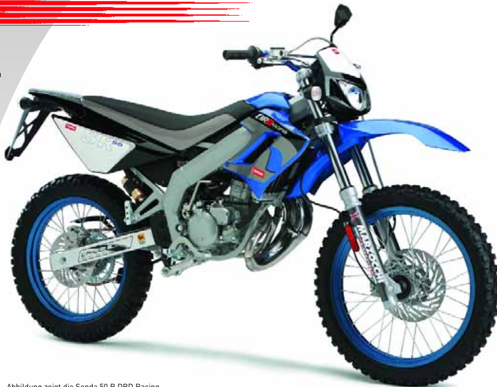
Abbildung zeigt die Senda 50 R DRD Racing

Irrtümer und technische Änderungen vorbehalten. Abbildungen können vom Produkt abweichen.