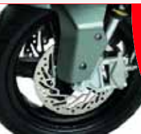
Bremsanlage GP1 250