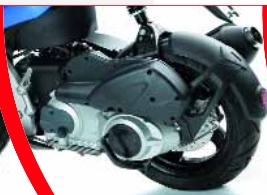
Antriebsinheit GP1 125