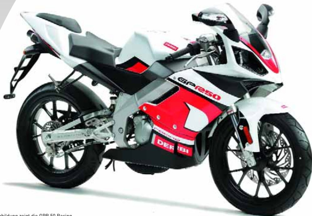
Abbildung zeigt die GPR 50 Racing

25 km/h-Drossel für die 50er sowie 80 km/h-Drossel für die 125er auf Anfrage.