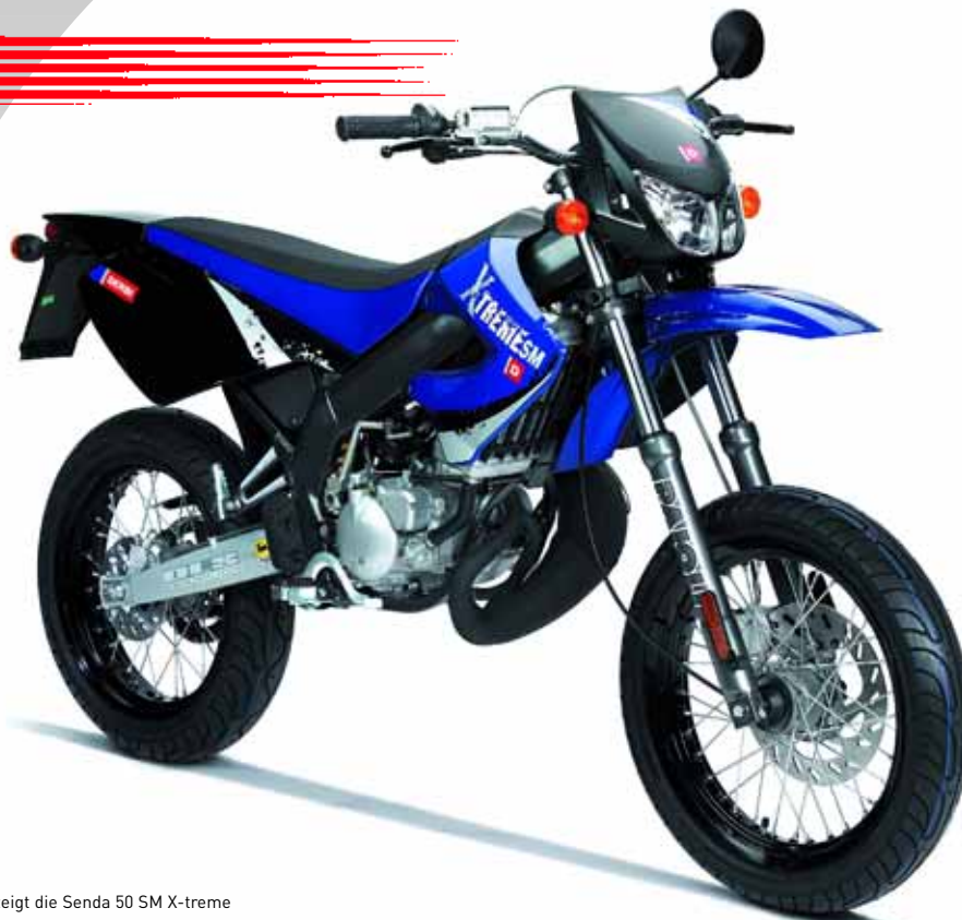
Abbildung zeigt die Senda 50 SM X-treme

Irrtümer und technische Änderungen vorbehalten. Abbildungen können vom Produkt abweichen.