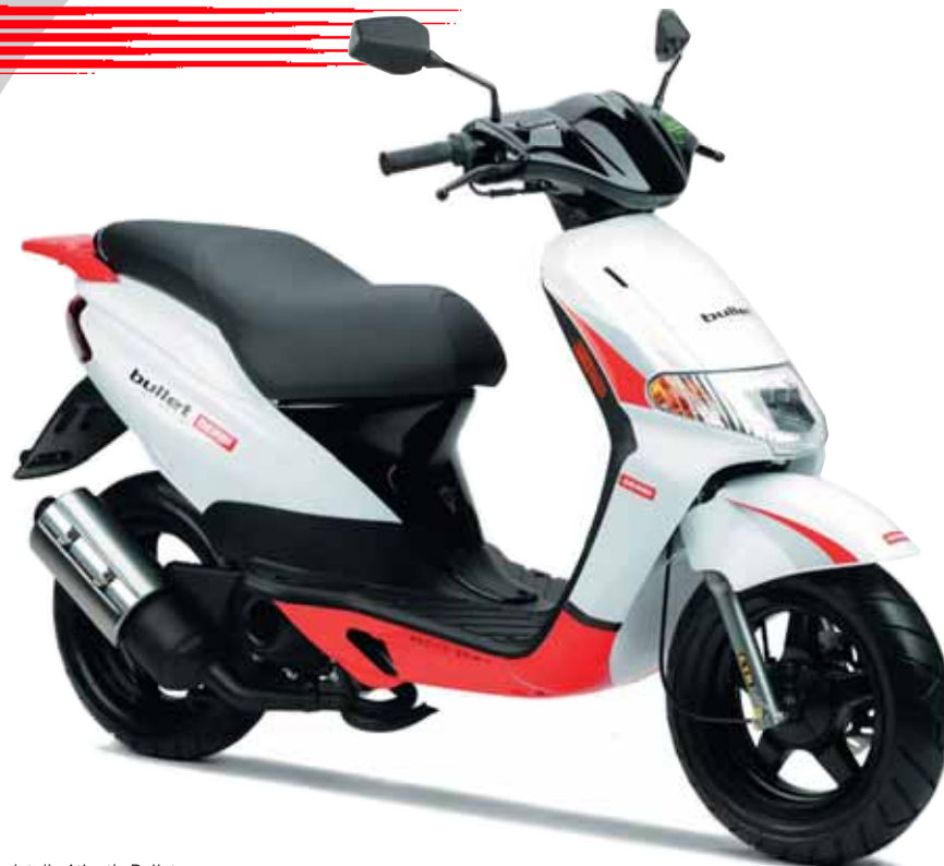
Abbildung zeigt die Atlantis Bullet

Wer einen angenehm laufruhigen Antrieb wünscht, sollte den Atlantis 4-Takt wählen.