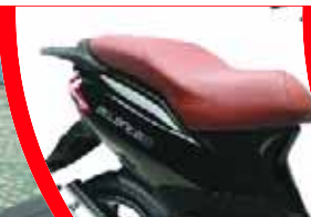
Sitzbank der City