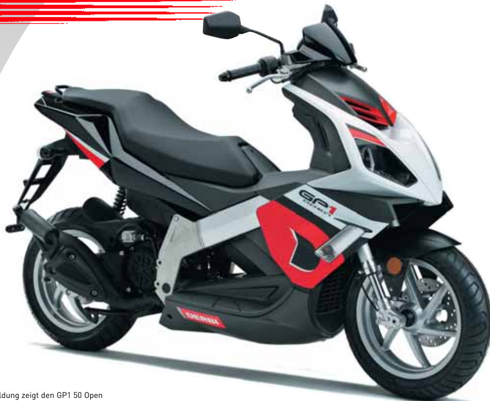
Abbildung zeigt den GP1 50 Open

Irrtümer und technische Änderungen vorbehalten. Abbildungen können vom Produkt abweichen.