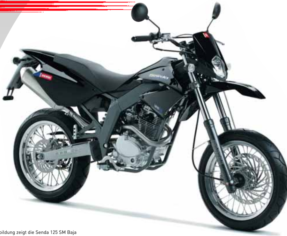
Abbildung zeigt die Senda 125 SM Baja

Irrtümer und technische Änderungen vorbehalten. Abbildungen können vom Produkt abweichen.